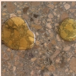
MANCHA DE ACEITE