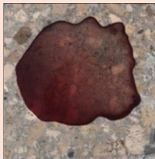
MANCHA DE VINO