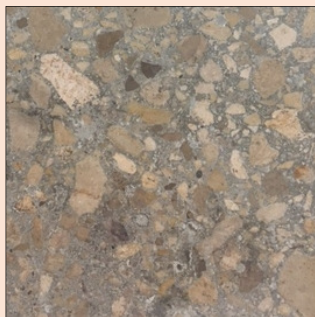
LIMPIEZA CON PAPEL