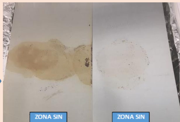
LIMPIEZA CON PAPEL HÚMEDO